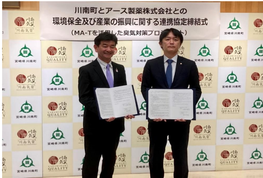
締結後の記念撮影

宮崎県児湯郡川南町とアース製薬株式会社（本社：東京都千代田区 以下「アース製薬」）は環境保全および産業の振興に関する連携協定を締結しました。町内の畜舎にて MA-T を活用した臭気対策の実証実験を進め、畜産の盛んな同町で長年の課題となっている家畜由来の臭気を低減し、生活環境の保全を図ります。