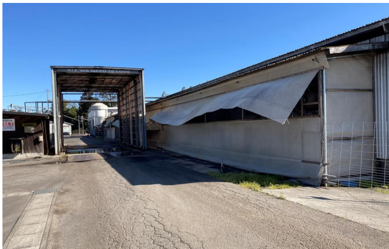
試験実施場所のイメージ

川南町は畜産が盛んな他の自治体に比べて面積が狭く、一般住宅と畜産施設が隣接、混在しており、家畜排せつ物の処理などの対策が重要な課題となっております。実証実験には MA-T を用いて、町内数か所の鶏舎や豚舎などで実施を予定しており、密閉された畜舎に換気ダクトを設置し、ダクト内に吸い込んだ空気に MA-T を散布し、臭気問題の解決を図ります。将来的には町内で臭気対策装置の製造も検討しており、『川南町モデル』の構築も目指しています。